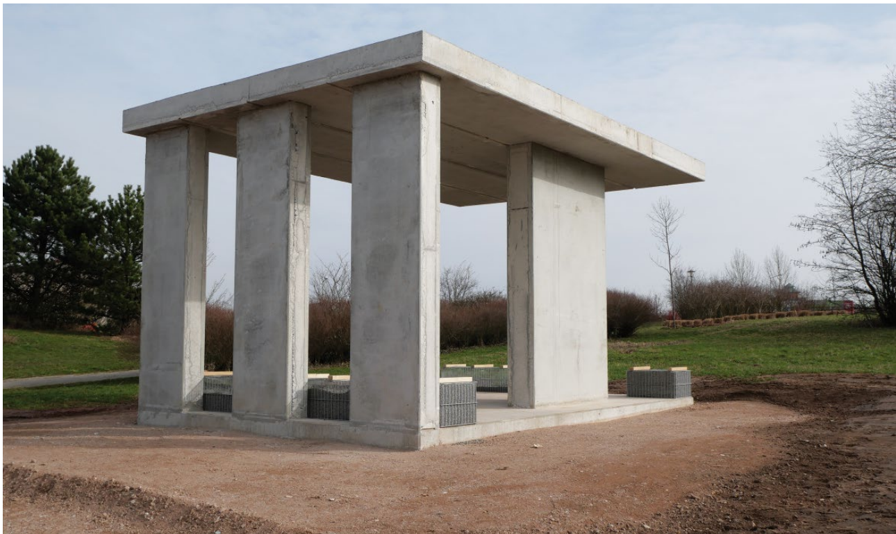
Bild 1. Fertiggestellter Pavillon aus R-Beton in Pirmasens

Das kurz vor dem Abschluss stehende EU-Projekt SeRaMCo (Secondary Raw Materials for Concrete Precast Products) hat die Steigerung des praktischen Einsatzes recycelter Bestandteile im Betonbau im Sinne der Nachhaltigkeit zum Ziel. An dem Forschungsprojekt mit über 7 Mio. Euro Gesamtvolumen waren elf europäische Forschungspartner aus Wissenschaft und Industrie beteiligt, darunter die SySpro-Gruppe Betonbauteile e.V. durch ihr Mitglied Beton-Betz aus Kirchart.