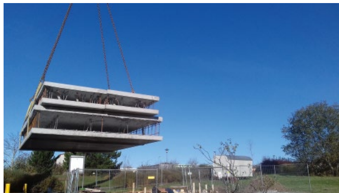
Bild 3. Entladung der Decken- und Wandelemente