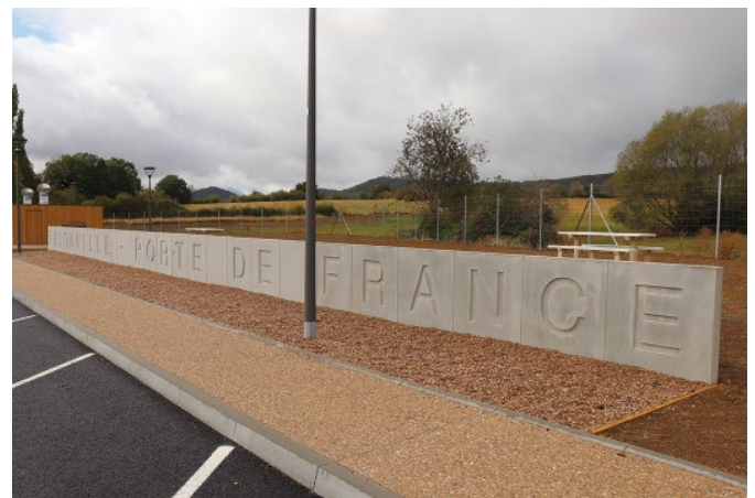
Bild 2. Ausgeführte Lärmschutzwand auf einem Rastplatz an der französischen Autobahn A 31 nahe Thionville

Bereits im September wurde der Öffentlichkeit eine repräsentative Lärmschutzwand auf einem Parkplatz an der französischen Autobahn A 31, 15 km von der Stadt Thionville entfernt mit der Inschrift „Thionville – Porte de France“ präsentiert. Die dafür verwendeten Fertigteile sind absolut innovativ, da sie zu 100 % aus recycelten Gesteins-